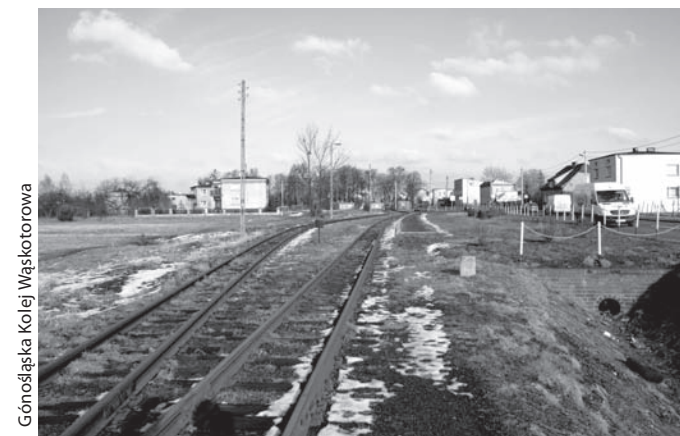
Górnosląska Kolej Wąskotorowa