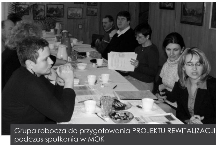
Grupa robocza do przygotowania PROJEKTU REWITALIZACJI podczas spotkania w MOK

z problemami ekonomicznymi w gminie. Omówiono także problemy dotyczące rodzin tych osób, w których zjawisko bezrobocia niierzadko jest dziedziczne oraz problemy mieszkańców, którzy mają pracę, lecz z różnych powodów, często niezależnych od nich samych – borykają się z różnego rodzaju problemami społecznymi. Zidentyfikowano także wiele problemów dotyczących dzieci i młodzieży w gminie.