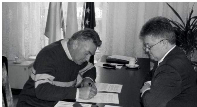
Podpisanie aktu notarialnego Fundacji na Rzecz Rozwoju Miasteczka Śląskiego.

darowizn, spadków i zapisów, uchwalanie rocznych planów działalności oraz planów finansowych, składanie oświadczeń woli oraz zawieranie umów, reprezentowanie Fundacji