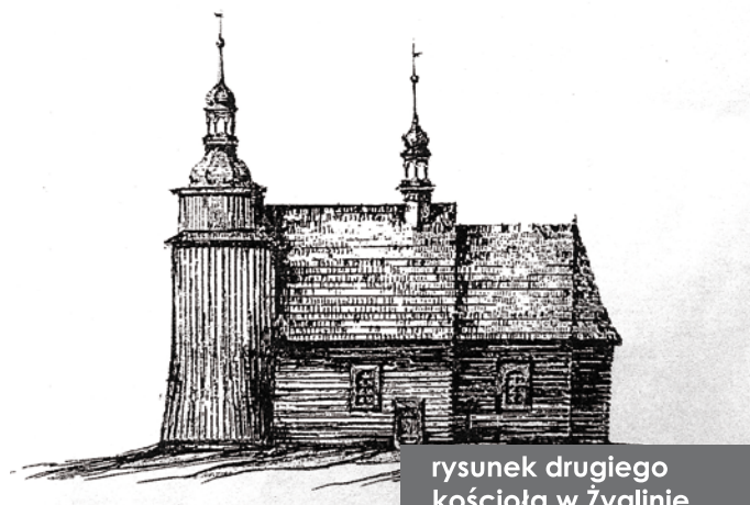
rysunek drugiego kościoła w Żyglinie

-wieża: długość 10 stóp (3,14 m), szerokość 15 stóp (4,71 m), wysokość (bez da-