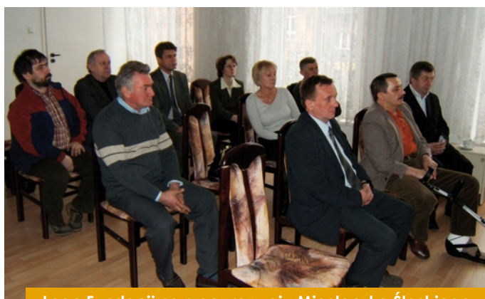
- Logo Fundacji na rzecz rozwoju Miasteczka Śląskiego - Fundatorzy Fundacji

7 marca w Urzędzie Miejskim w Miasteczku Śląskim został podpisany akt notarialny dokumentujący powstanie nowej fundacji o nazwie Fundacja na rzecz rozwoju Miasteczka Śląskiego. Fundatorami zostały firmy z Miasteczka Śląskiego oraz Tarnowskich Gór. Swą siedzibę Fundacja będzie miała w budynku Miejskiego Ośrodka Sportu i Rekreacji w Miasteczku Śląskim przy ulicy Srebrnej 6.