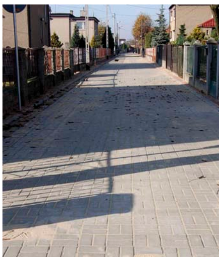
▲ Przebudowa ulicy Promiennej w Miasteczku Śląskim