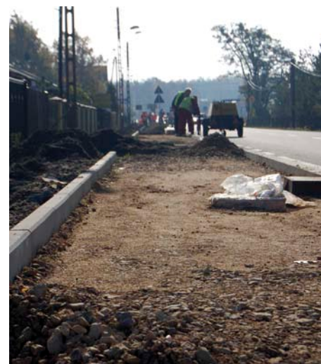
▲ Budowa chodnika w ciągu drogi wojewódzkiej nr 912 w Żyglinku