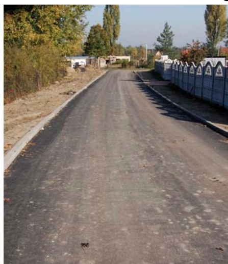
▲ Przebudowa ulicy Rolnej - Południowej w Żyglinie