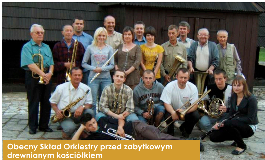
Obecny Skład Orkiestry przed zabytkowym drewnianym kościółkiem