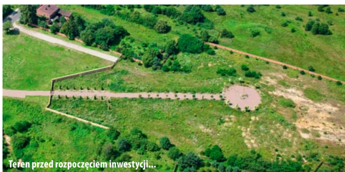
Teren przed rozpoczęciem inwestycji...