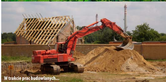
W trakcie prac budowlanych...