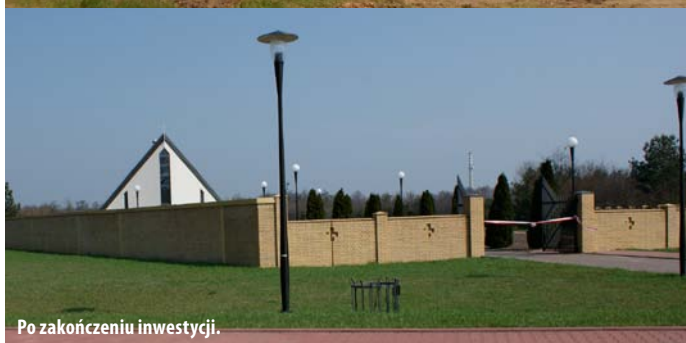
Po zakończeniu inwestycji.