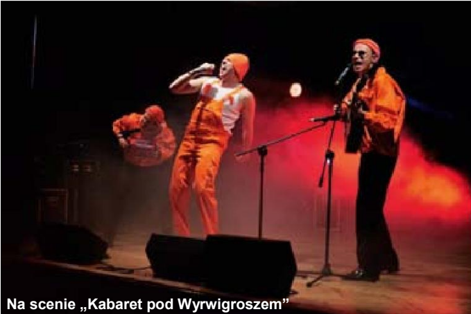
Na scenie „Kabaret pod Wyrwigroszem”

•• 14 listopada gościliśmy jeden z najbardziej popularnych kabaretów w Polsce – „Kabaret pod Wyrwigroszem”. Humor, jak to na takim spotkaniu być powinno, oczywiście dopisał, a sala wypełniona do ostatniego miejsca bawiła się doskonale. Kabaret przedstawił nam najnowsze skecze, m.in. dotyczące segregacji śmieci oraz otrzymywania niechcianych sms-ów.