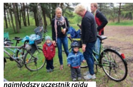
najmłodszy uczestnik rajdu

W dniu 26 kwietnia odbył się II Rodzinny Rajd Rowerowy „Leśno Rajza” zorganizowany przez Burmistrza Miasta Miasteczko Śląskie. Grupa około trzydziestu rowerzystów ruszyła spod