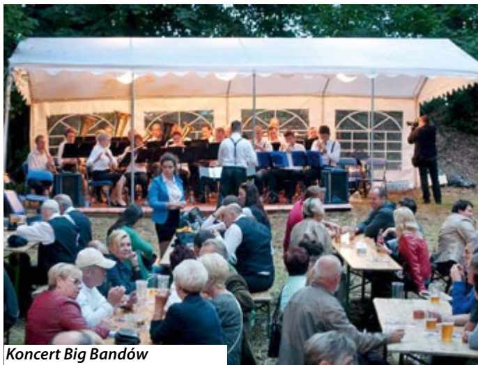
Koncert Big Bandów

29 sierpnia w Parku Rubina odbyła się czwarta edycja Festiwalu Big Bandów i Orkiestr. Pogoda dopisała, więc można było spotkać się na miłej pogawędce ze znajomymi – tak jak to było przed wielu laty; posłuchać dobrej muzyki, zarówno jazzowej, swingu, bluesa oraz znanych przebojów muzyki rozrywkowej i filmowej.