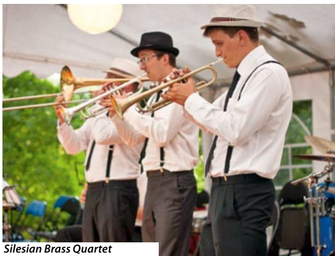
Silesian Brass Quartet