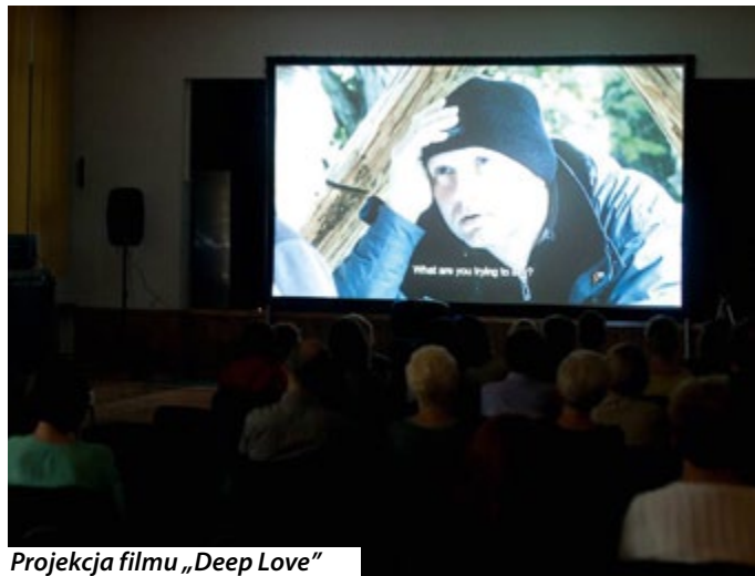
Projekcja filmu „Deep Love”

1 września kolejny raz gościliśmy Polskę Światłoczułą z głośnym filmem w reżyserii Jana P. Matuszyńskiego „Deep Love”.