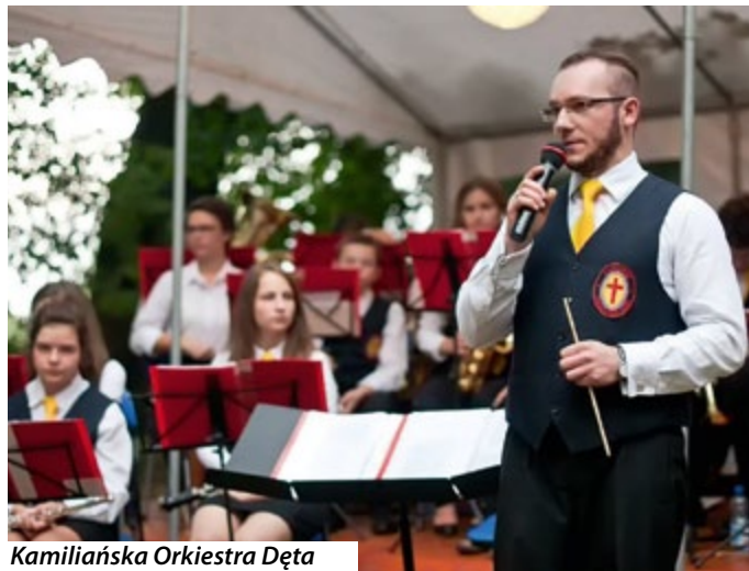
Kamilińska Orkiestra Dęta

Swoje umiejętności i wysoki kunszt zaprezentowali – Orkiestra Reprezentacyjna Gminy Miasteczko Śląskie, Silesian Brass Quartet, M.A.Z.E.M oraz Kamilińska Orkiestra Dęta. Mamy nadzieję, że impreza była udana, podobała się zgromadzonej licznie publiczności i spotkamy się w parku znów za rok.