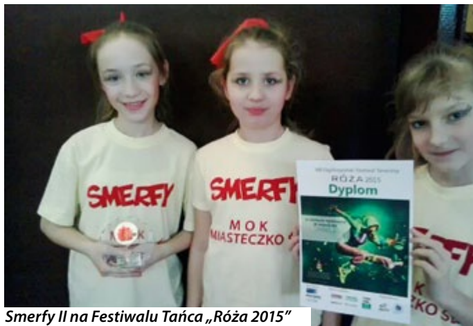
Smerfy II na Festiwalu Tańca „Róża 2015”

7 marca zespoły Crazy I i Smerfy II wzięły udział w VIII Festiwalu Tańca „Róża 2015” w Sosnowcu, przywożąc stamtąd wyróżnienia III stopnia. Przed nimi kolejny konkurs – tym razem w Zatorze.