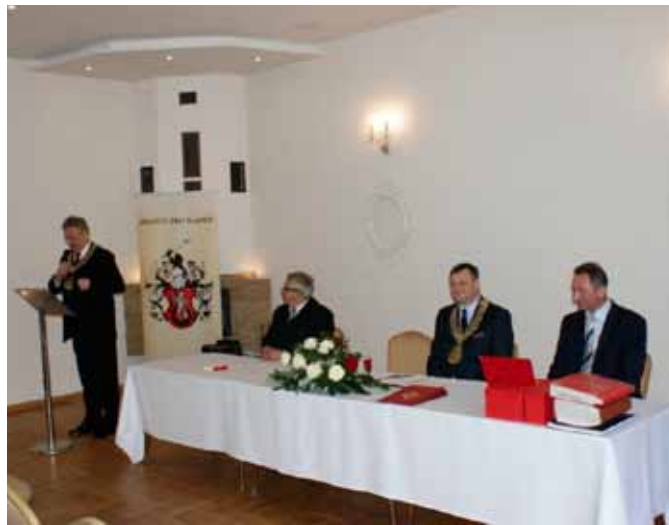
Uroczysta sesja – burmistrz miasta, przewodniczący i wiceprzewodniczący RM.