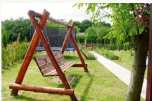
k ROD „Odrodzenie” dz. nr 53