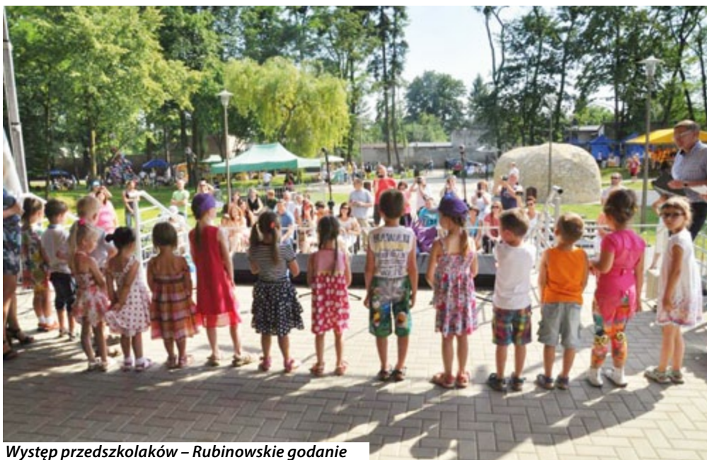
Występ przedszkolaków – Rubinowskie godanie