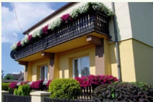
zur, ul. Śląska 63