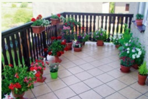
k, ROD „Czerwona Róża” dz. nr 25