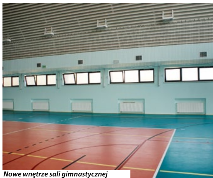
Nowe wnętrze sali gimnastycznej