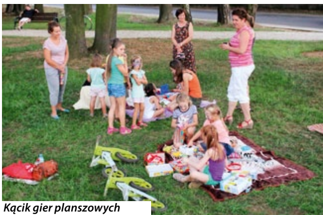
Kącik gier planszowych

Ze względu na różnorodność i atrakcyjność, koncerty cieszyły się bardzo dużym zainteresowaniem mieszkańców. Przegląd dodatkowo wzbogacił kącik gier planszowych zorganizowany przez Szkołę Języka Angielskiego Be English.