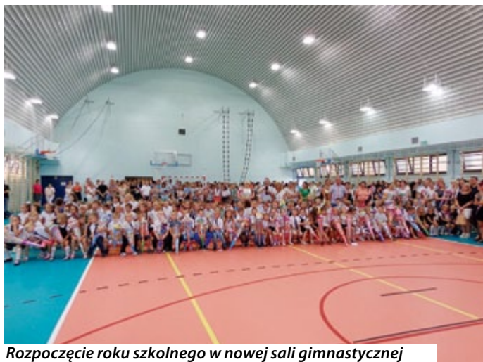
Rozpoczęcie roku szkolnego w nowej sali gimnastycznej