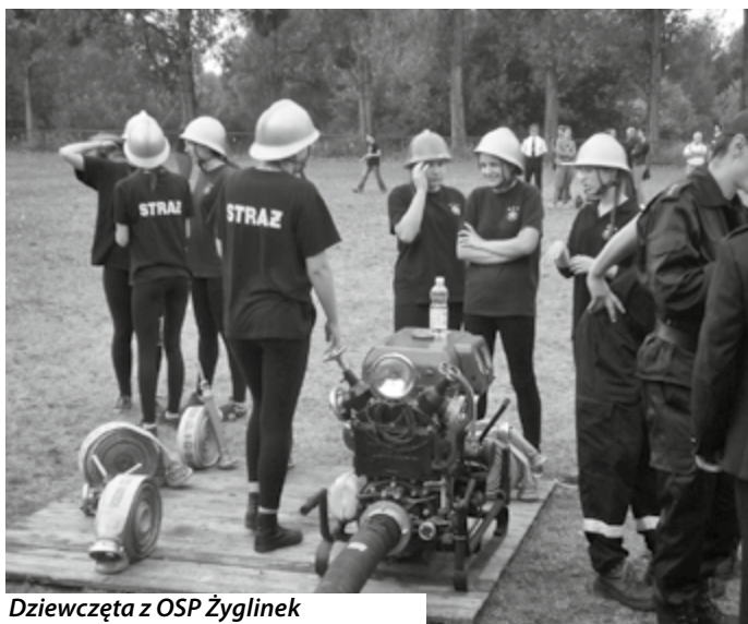
Dziewczęta z OSP Żyglinek

W zawodach powiatowych (19 września 2015 r. w Kaletach) reprezentować rejon będą dwa pierwsze zespoły seniorskie oraz NASZA Młodzieżowa Drużyna Pożarnicza z Żyglinka. Życzymy powodzenia. Kolejne zawody już za rok. ▸