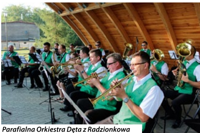
Parafialna Orkiestra Dęta z Radzionkowa

Ze względu na różnorodność i atrakcyjność, koncerty cieszyły się bardzo dużym zainteresowaniem mieszkańców. Przegląd dodatkowo wzbogacił kącik gier planszowych zorganizowany przez Szkołę Języka Angielskiego Be English.