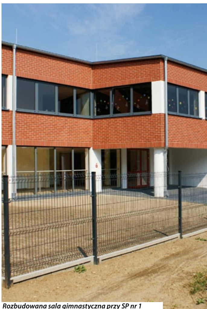
Rozbudowana sala gimnastyczna przy SP nr 1

Szczegółowe informacje będą widniały na plakatach w ciągu najbliższych dni. Jest to dla naszego miasta ważne wydarzenie dlatego też serdecznie zapraszamy wszystkich do wzięcia w nim udziału. ▶