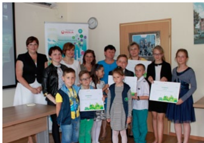
Nagrodzeni i wyróżnieni uczniowie Szkoły Podstawowej nr 1 i Szkoły Podstawowej nr 2 w Miasteczku Śląskim wraz z dyrektorami szkół i opiekunami w Siedzibie Fundacji Veolia Polska.