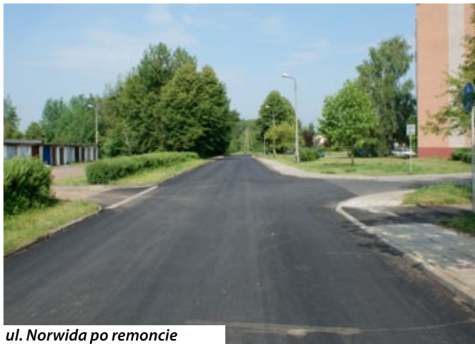
ul. Norwida po remoncie

Urząd Miejski w Miasteczku Śląskim uprzejmie informuje, że przeprowadzony został remont ul. Norwida w Miasteczku Śląskim na odcinku od skrzyżowania z ul. Asnyka do skrzyżowania z ul. Złotą. Remont na ww. odcinku polegał na wymianie i regulacji urządzeń kanalizacji sanitarnej i deszczowej, frezowaniu i uzupełnieniu ubytków nawierzchni, ułożeniu nakładki bitumicznej oraz częściowej wymianie krawężników.