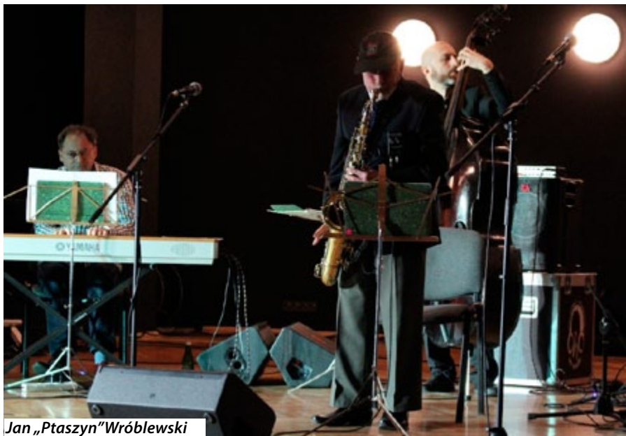
Jan „Ptaszyn” Wróblewski

Najważniejszym wydarzeniem minionego miesiąca w MOK-u był koncert mistrza polskiego jazzu Jana „Ptaszyna” Wróblewskiego, który otwierał XIV Tarnogórskie Spotkania Jazzowe.