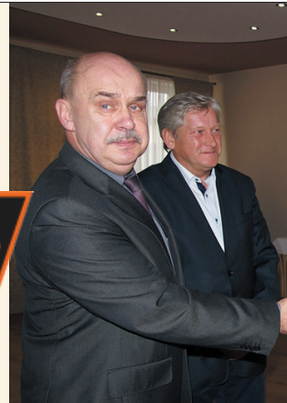
Więcej zdjęć można znaleźć na: http://www.miasteczko-slaskie#prettyPhoto