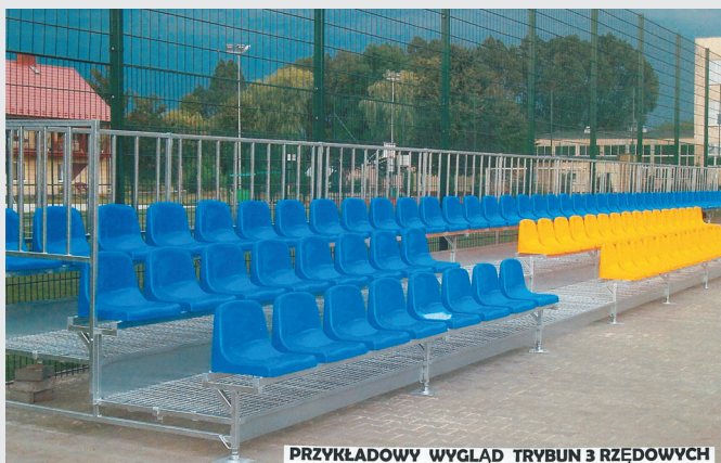
PRZYKŁADOWY WYGLĄD TRYBUN 3 RZĘDOWYCH