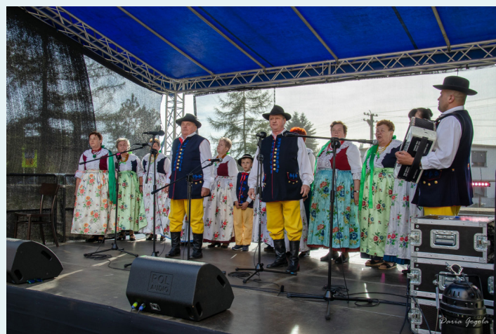
Miejski Ośrodek Kultury w Miasteczku Śląskim