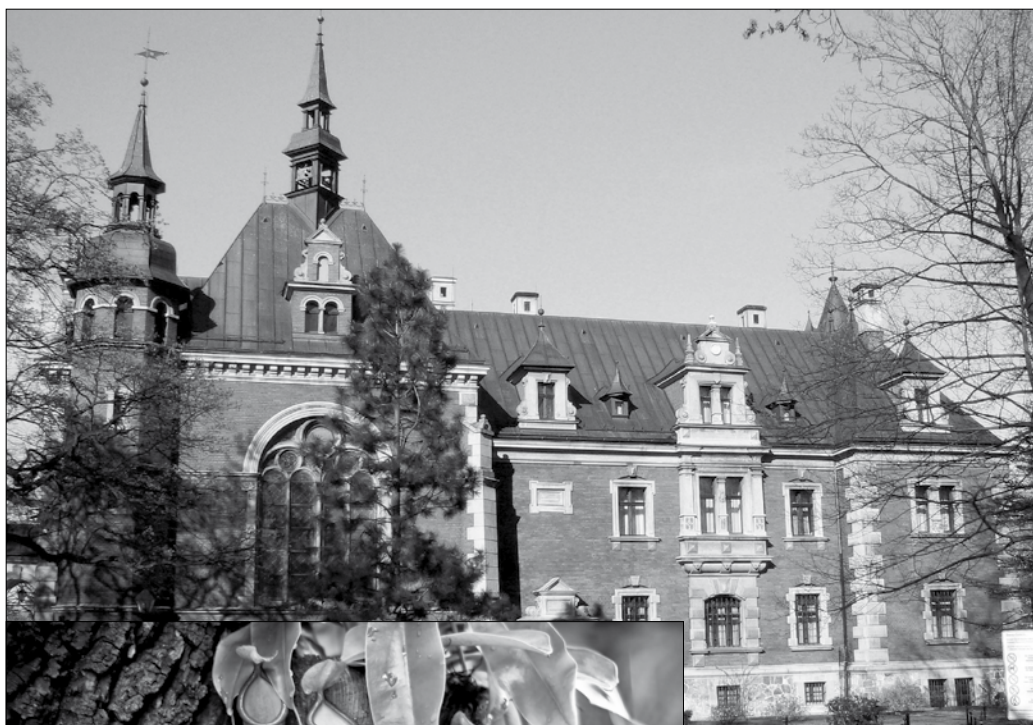
Pałac w Pławniowicach

Warto udać się do toszeckiego zamku, w którym również odbywają się imprezy kulturalne, a po drodze odbić na Pławniowice, gdzie na plażach