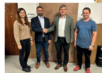
◀ Sołtys i Rada Sołecka Bibliela