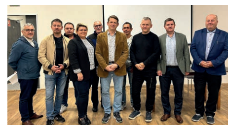
▲ Sołtys i Rada Sołecka Żyglin-Żyglinek