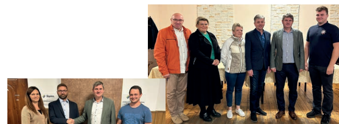
▲ Sołtys i Rada Sołecka Brynica