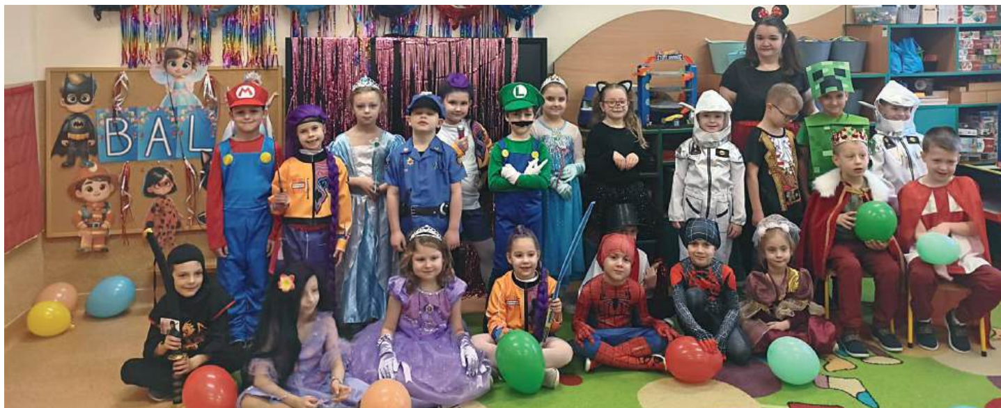
Luty to także okres balów karnawałowych, pełen kolorowych przebierańców, tańców i konkursów