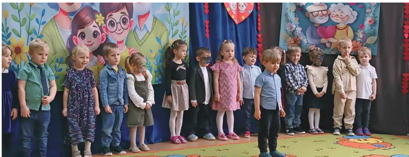
Styczeń to miesiąc, w którym na szczególną uwagę zasługują nasi kochani dziadkowie. Każde z przedszkoli przygotowało specjalne występy dla babć i dziadków. Było wiele wzruszeń, uśmiechów oraz powodów do dumy