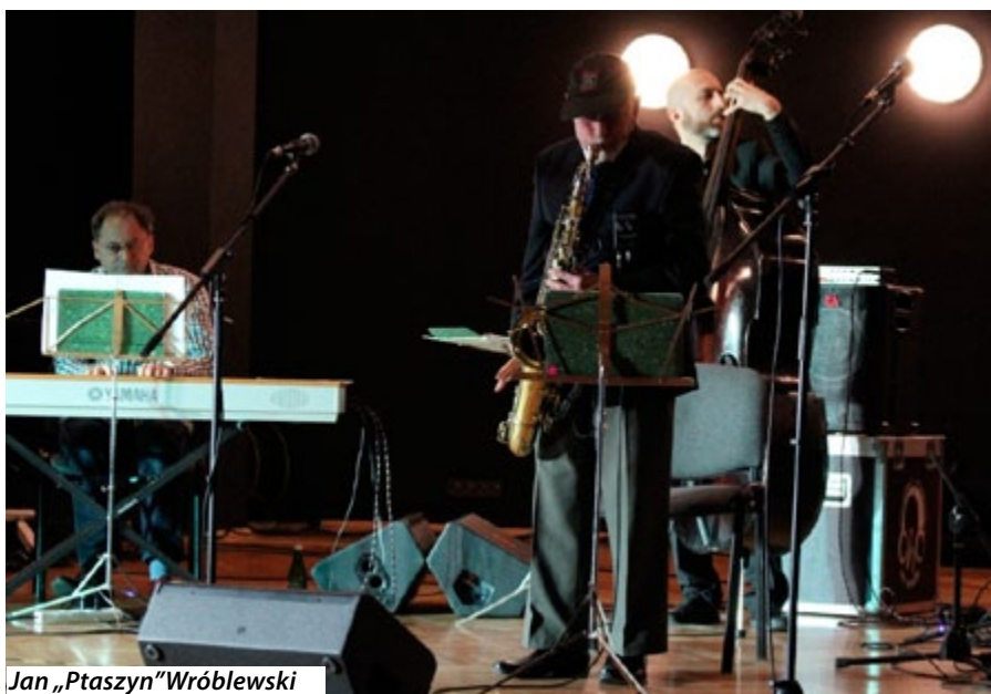
Jan „Ptaszyn” Wróblewski

Najważniejszym wydarzeniem minionego miesiąca w MOK-u był koncert mistrza polskiego jazzu Jana „Ptaszyna” Wróblewskiego, który otwierał XIV Tarnogórskie Spotkania Jazzowe.